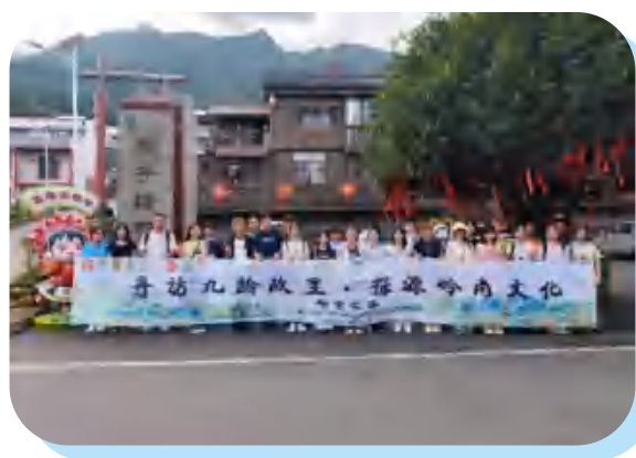
考察瑶族雕子堂村