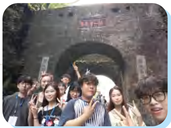
港澳学生走梅关古道