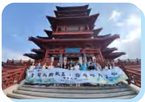
参观张九龄纪念公园