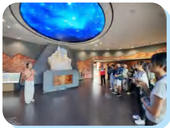
赴马坝人遗址参观学习